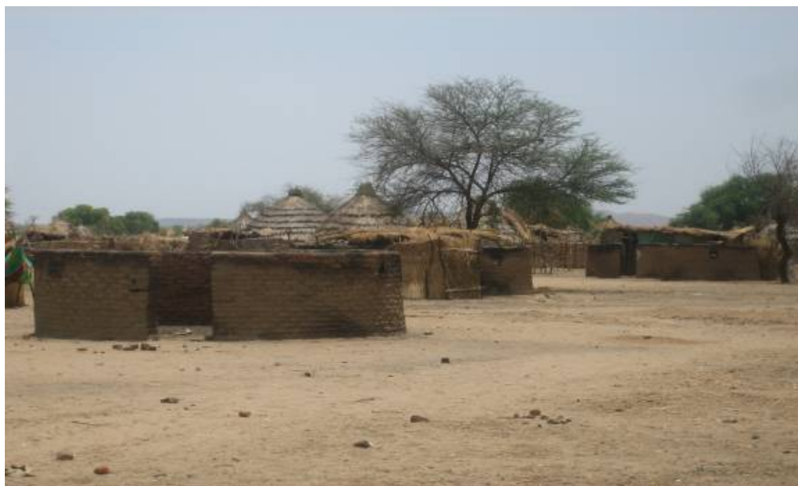
Maisons brûlées dans le village d'Aradib, 29 avril 2007

Dans l'est du Tchad, les populations civiles sont confrontées à de graves risques sécuritaires liés à la fois aux combats continus entre les divers groupes armés et aux attaques sur les villages et les sites pour personnes déplacées. Des actes de violence à l'encontre des populations civiles sont commis par les milices et les mouvements rebelles soudanais et tchadiens et parfois par des soldats de l'ANT. Selon certaines informations, les populations civiles seraient délibérément ciblées, en particulier les femmes et les enfants. 16 Les personnes déplacées sont exposées à un ensemble de menaces contre leur sécurité personnelle et leur intégrité, même lorsqu'elles sont dans des sites pour personnes déplacées. Il y a eu des cas de meurtres arbitraires, y compris des personnes brûlées vives, de viols et de mutilations. En outre, les personnes déplacées voient souvent leurs maisons et leurs biens détruits ou volés. Les attaques sont d'intensité variable et vont du vol de bétail à la mise à feu de villages entiers. Des centaines et des centaines de maisons ont été réduites en cendres et leurs habitants ont perdu tous leurs biens, y compris leur bétail et leurs réserves de vivres. 17 Les attaques contre des travailleurs humanitaires et les cas de vols de véhicules du personnel humanitaire seraient également en augmentation. 18