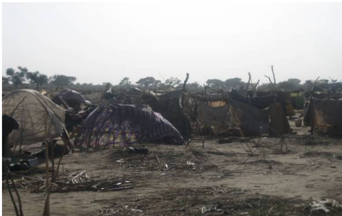
Abri pour personnes déplacées pour les nouveaux arrivants sur le site de Habilé III, 29 avril 2007

prestation de soins médicaux est limitée et l'état de santé des personnes déplacées est précaire. 41