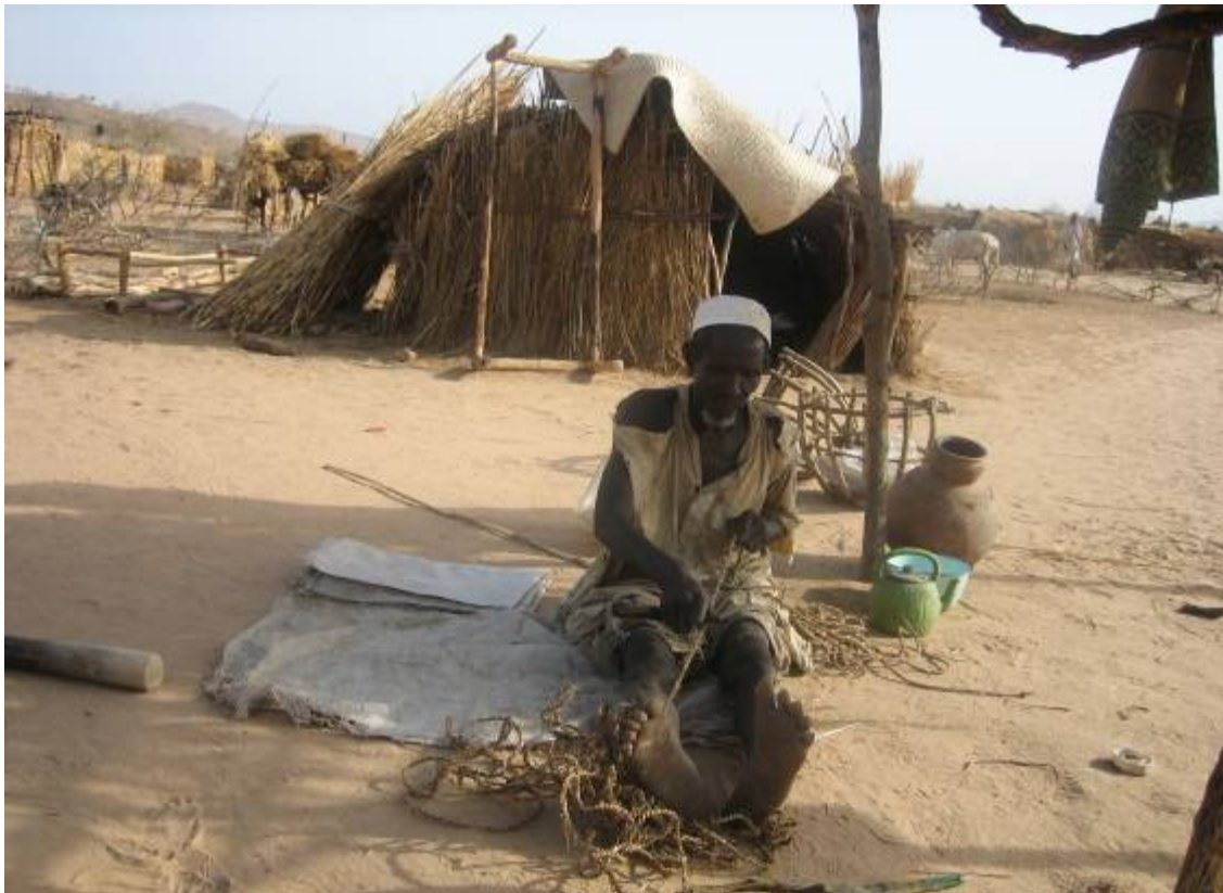
Un homme déplacé âgé construit un lit dans le site pour personnes déplacées de Gouroukoum, 28 avril 2007

Jusqu'à récemment, l'aide fournie par de nombreuses organisations au Tchad se concentrait sur les réfugiés arrivant du Darfour (Soudan) et négligeait les communautés d'accueil et les personnes déplacées. En effet, pendant les premiers mois de déplacements, de très bons mécanismes de solidarité existaient parmi la population. Bien avant l'intervention des organisations humanitaires, les personnes déplacées étaient prises en charge par les communautés d'accueil qui leur fournissaient des abris et des vivres bien que leurs propres ressources soient très limitées. Dans certaines zones, les conditions de vie des personnes déplacées n'ont pas été évaluées depuis le début des déplacements et l'évaluation des besoins est difficile. La détérioration continue de la situation sécuritaire et le nombre croissant de personnes déplacées ont conduit à une réduction significative des ressources, déjà rares, des communautés d'accueil dont la vulnérabilité est dans certaines zones équivalente à celle des personnes déplacées. 33 Néanmoins, les groupes déplacés, en particulier les déplacés récents, sont confrontés à des difficultés particulières pour avoir accès à la nourriture, à l'eau et aux soins de santé.