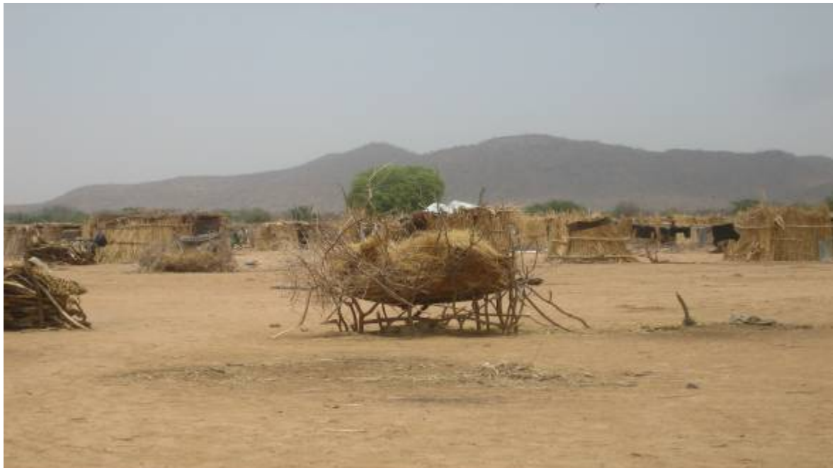
Site pour personnes déplacées à Gassiré, 28 avril 2007

Lorsque les déplacements ont commencé, le gouvernement tchadien et les organisations humanitaires sont tombés d'accord sur la nécessité d'éviter d'installer des « camps » pour personnes déplacées de façon à ne pas créer d'« effet d'appel » pour toutes les personnes en quête désespérée d'aide humanitaire. A l'origine, les déplacés vivaient au sein de familles d'accueil et recevaient de l'aide principalement à travers les programmes basés sur les communautés. Cependant, alors que de plus en plus de civils se voyaient contraints de fuir leurs maisons et leurs villages, il n'était plus possible d'éviter les installations. Le gouvernement, en coopération avec les organisations humanitaires, a alors sélectionné un certain nombre de sites proches des villages d'accueil, auxquels les organisations humanitaires ont accès et où les personnes déplacées peuvent avoir accès à l'eau et à des terres arables et être protégées. Toutefois, dans certaines zones comme à Goz Beida, même après des négociations entre le gouvernement, le HCR et les personnes déplacées, ces dernières ont refusé de se rendre dans de nouveaux sites alors que leurs installations actuelles étaient inondables, ne répondaient pas aux critères convenus et appartenaient à des communautés d'accueil qui en auraient besoin pour les cultiver. 30