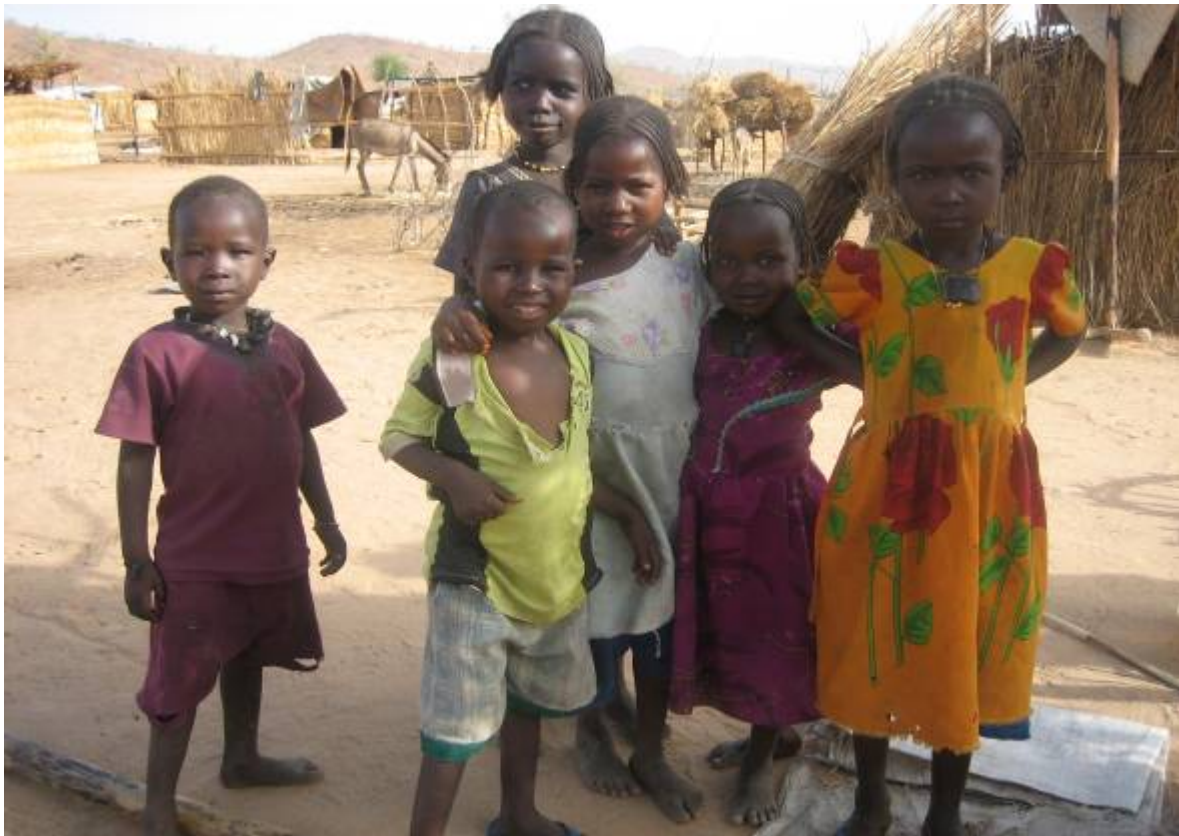
Enfants déplacés dans le site de Gouroukoun, 28 avril 2007

La maintenance des infrastructures scolaires représente un autre défi. Les personnes déplacées manquent de fournitures scolaires, d'enseignants et de maîtres communautaires. De nombreux enseignants parmi les enseignants actuels viennent des communautés déplacées et n'ont pas les compétences suffisantes. Nombreux ont été embauchés par des organisations humanitaires. La violence persistant, les associations de parents d'élèves se sont effondrées et ont besoin d'être restructurées y compris dans les sites pour personnes déplacées.