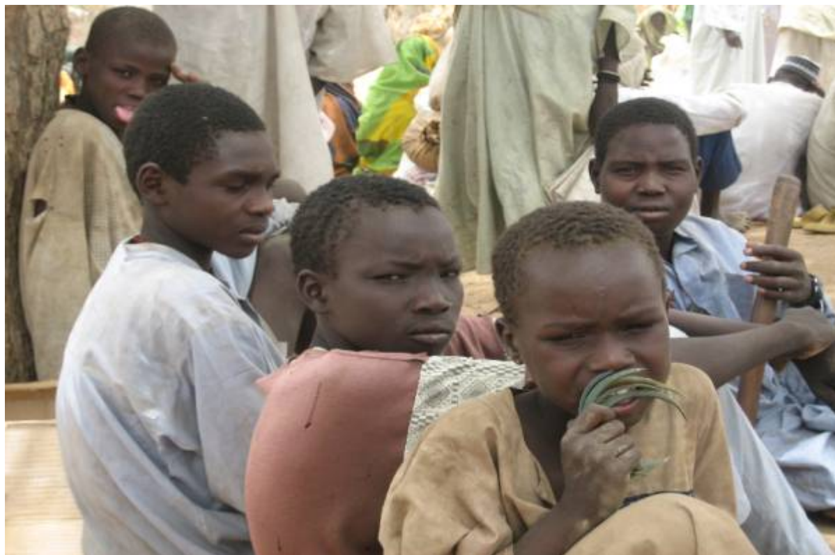
Jeunes garçons attendant la distribution de provisions du gouvernement dans le site de Gassiré, 28 avril 2007

Récemment, le gouvernement tchadien a admis qu'il existait des enfants soldats au sein de l'ANT et a signé un accord avec l'UNICEF pour démobiliser les enfants enrôlés dans les forces et groupes armés. L'UNICEF va également aider le gouvernement à prévenir le recrutement d'enfants et à assurer leur libération et leur réintégration au sein de leurs communautés. 29