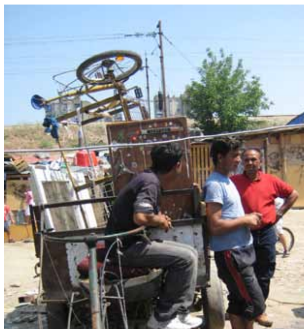
Un grupo de desplazados internos gitanos en un asentamiento informal en Serbia. Sus posibilidades de integración son limitadas por tener pocas oportunidades para ganarse la vida.