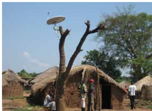
Un grupo de desplazados internos en una "zona de tránsito" cerca de su lugar de origen en el norte de Uganda (Foto: IDMC/Cecilia Jimenez, noviembre de 2009).

La vivienda es otro obstáculo común para hallar soluciones duraderas, dado que los desplazados internos siguen alojándose en viviendas ruinosas y hacinadas, a menudo con falta de seguridad de la tenencia. Los programas de asistencia con la vivienda en Colombia, Georgia y Serbia, por ejemplo, no han conducido a una adquisición generalizada de viviendas permanentes, a pesar de que en Georgia la vivienda adecuada fue el único aspecto en el que se observaron avances y estancamiento al mismo tiempo, ya que algunos desplazados internos han conseguido vivienda permanente en los últimos años. En Burundi y el Sudán meridional, muchos