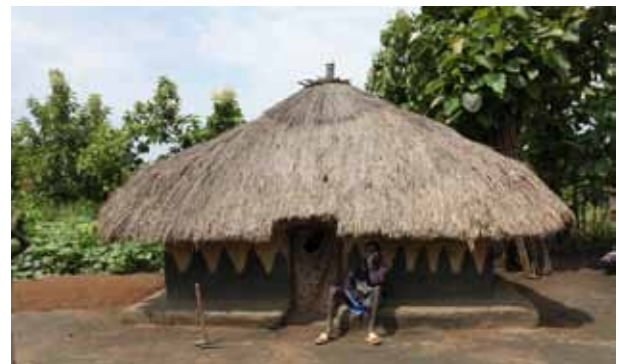
Un desplazado interno en Yei, Sudán del Sur, en frente de su choza tradicional hecha de barro y paja llamada tukul (Foto: IDMC/Nina Sluga, junio de 2010).

Los panelistas discutieron el cruce entre las políticas que tiene por objetivo asistir a los desplazados internos y las políticas dirigidas a la población local en general, y