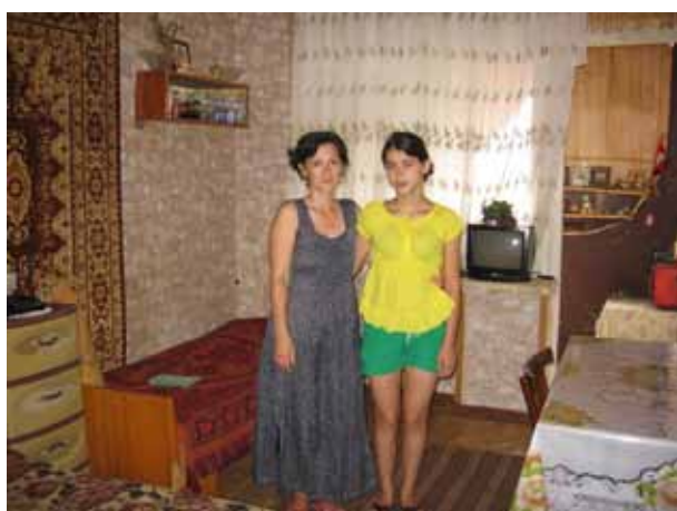
Madre e hija, ambas desplazadas internas, en el cuarto del centro colectivo en donde han vivido con sus parientes durante más de 15 años (Foto: IDMC/Nadine Walicki, julio de 2010).

El seminario se centró en las experiencias de seis países con desplazamiento interno prolongado - Burundi, Colombia, Georgia, Serbia, Sudán meridional y Uganda. Los informes resultantes de los estudios de campo encomendados a cada país fueron distribuidos antes del seminario. También se distribuyó material de fondo que incluía una visión general de la integración local de los desplazados internos en situación de desplazamiento prolongado, así como documentos de consulta sobre soluciones duraderas.