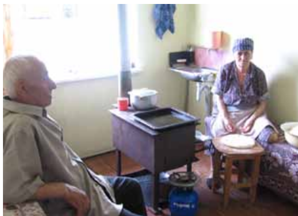
Una pareja de desplazados internos en la unidad del centro colectivo en donde han vivido durante 15 años y de la cual son dueños hoy en día (Foto: IDMC/Nadine Walicki, julio de 2010).

Los oradores también destacaron que debería tomarse un enfoque específico al contexto o diferenciado en el diseño de las políticas y programas de soluciones duraderas para los desplazados. Es importante que los gobiernos y otras partes interesadas reconozcan que, dependiendo de la etapa del desplazamiento, pueden ser apropiadas distintas alternativas de asentamiento, y éstas deben ser cuidadosamente presentadas, de acuerdo con las preferencias de los desplazados internos y sobre la base de un análisis del contexto político. La promoción de la integración local de los desplazados deberá basarse en principios, ser estratégica y prag-