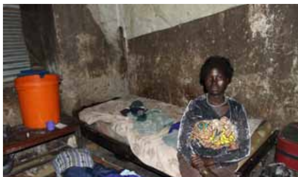
Un desplazado interno ocupando una casa en Yei, Sudán del Sur. Desde que los propietarios de viviendas empezaron a regresar en el 2005, los desplazados se han visto obligados a desalojar las casas que han estado ocupando, a menudo sin recibir ningún tipo de compensación o parcela alternativa (Foto: IDMC/Nina Sluga, junio de 2010).

La reunión se inició con las palabras de bienvenida de Elizabeth Ferris, Socio Principal de la Institución Brookings, y Kate Halff, Directora del IDMC. Ambas oradoras destacaron la importancia de centrarse en la integración local como una solución a través de la cual podrían lograrse soluciones al desplazamiento prolongado, y señalaron que hasta ahora se ha prestado muy poca atención a esta alternativa de asentamiento. Si bien el regreso al lugar de origen es con frecuencia la solución preferida para el desplazamiento prolongado, en muchas situaciones el regreso simplemente no es una opción, al menos en un futuro inmediato, y es importante considerar distintas maneras de apoyar la integración local como un medio para poner fin al desplazamiento y mejorar el acceso a los derechos fundamentales. La elaboración del Marco de soluciones duraderas para los desplazados internos , del IASC, fue un paso hacia delante en el perfilamiento de las condiciones y procesos a través de los cuales se logran soluciones duraderas.