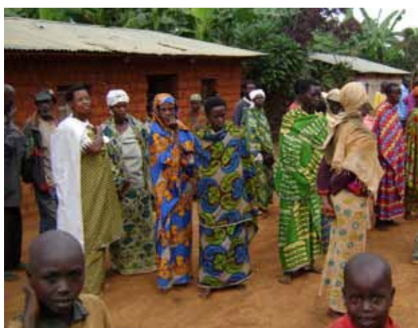
Residentes de un asentamiento para grupos vulnerables que incluye desplazados internos en Kigoma, Burundi (Foto: IDMC/Greta Zeender, junio de 2010).