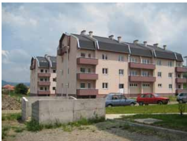
Viviendas de interés social en Kraljevo, Serbia, para desplazados internos vulnerables quienes han estado viviendo en centros colectivos (Foto: IDMC/Barbara McCallin, mayo de 2009).

de cuestiones relacionadas con el desplazamiento en los planes de desarrollo local, con la participación de representantes de las comunidades desplazadas en la concepción, elaboración y ejecución de dichos planes (Georgia, Serbia)